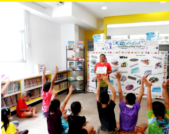
ห้องสมุดฯ บ้านจिरาย-พุนทรีย (ห้องสมุดภาษาศาสตร์)